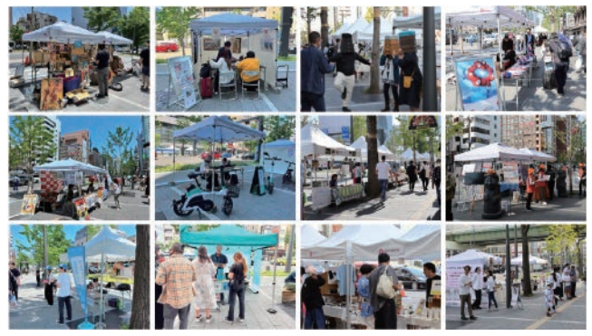
▲2023年開催の座・御堂筋