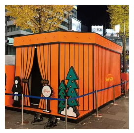
写真左：Bright You Namba (なんば広場)、右上：Bird on a Rock (TIFFANY)、右下：ランタンスノードーム (Hermès)▶