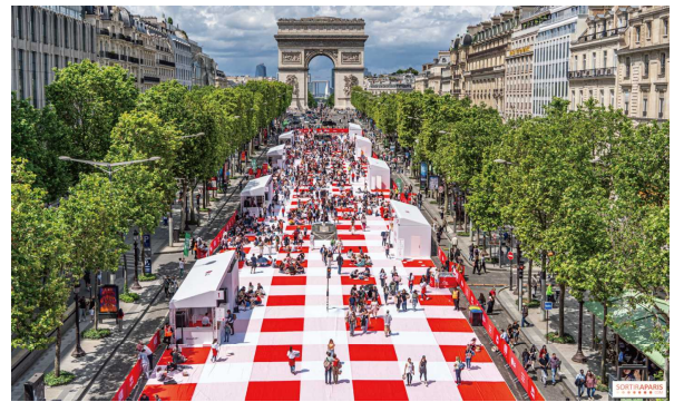
シャンゼリゼ大ピクニック ▶