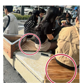
▲ 2期区間におけるベンチ木質化プロジェクト

■ 適正化部会の開催 (12/2) ・1/27(月)からの大阪市内全域路上喫煙禁止、路上ミュージシャン、万博に向けた啓発キャンペーン等について意見交換を行なった