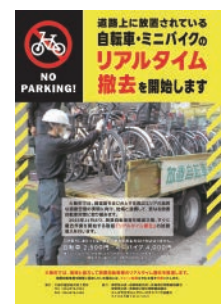
▲ 放置自転車・ミニバイクのリアルタイム撤去の案内