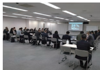
▲ 定例会 (10月30日 難波御堂筋ホール)

当会の会員各位には、大阪観光局より、御堂筋イルミネーション 2023 のポスター・ガイドブックが届きます。ご活用ください。