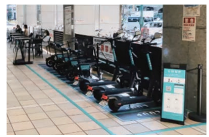
▲ 放置自転車多発エリアがポート設置で改善 (京阪天満橋駅前 Luup 様資料より)