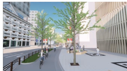
▲御堂筋 メタバースプロジェクト

■12/10 ほこみち全国会議 登壇 ■12/23 地方シンクタンク協議会フォーラム 登壇