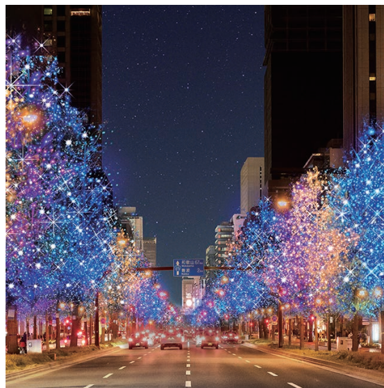
御堂筋イルミネーション 2020の様子