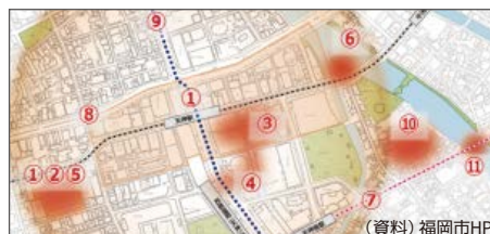
天神ビッグバン 他の主なプロジェクト