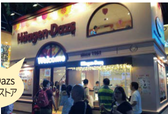
Häagen-Dazs ポップアップストア