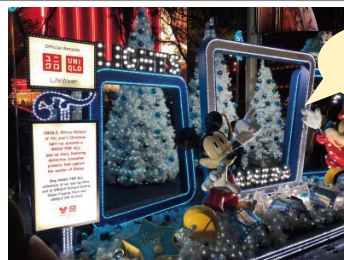
Disney x ユニクロ