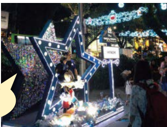
Disney x 日立