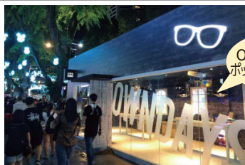
OWNDAYS ポップアップストア