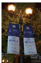
昨年度、当会で設置した街頭バナー