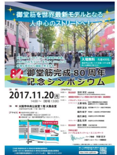
<秋のシンポジウムチラシ>