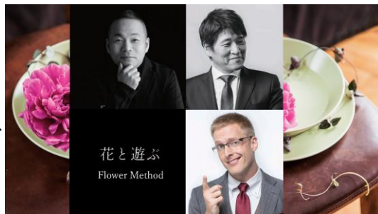
イベントページ（Facebook より） https://www.facebook.com/events/1494761717229922/