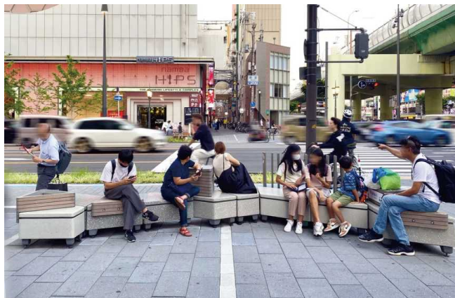
▲御堂筋ほこみちユニットベンチ

御堂筋ほこみちユニットベンチが、グッドデザイン賞を受賞しました。社会実験「御堂筋チャレンジ(2021-2024年)」にて、豊かな道路空間づくりを目標に、このエリアに相応しい滞留区間のかたちを求めて、ベンチの形態や配置・素材を複数回試行しながら滞在や利用の効果を検証し、結果を配置案に反映したベンチです。