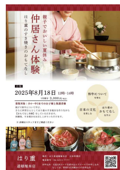
▲ はり重「中居さん体験」

TEL: 06-6205-3600 FAX: 06-6205-3601 E-mail: minami-midosuji@arpak.co.jp