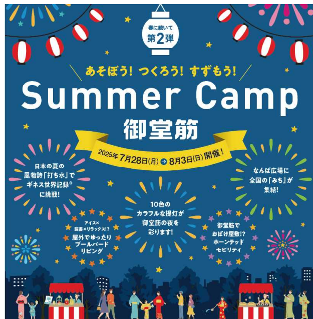
▲ SummerCamp 御堂 (イメージ) ※内容は変更になる場合があります