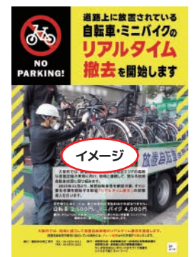
▲ 放置自転車・ミニバイクのリアルタイム撤去の啓発チラシ【イメージ】